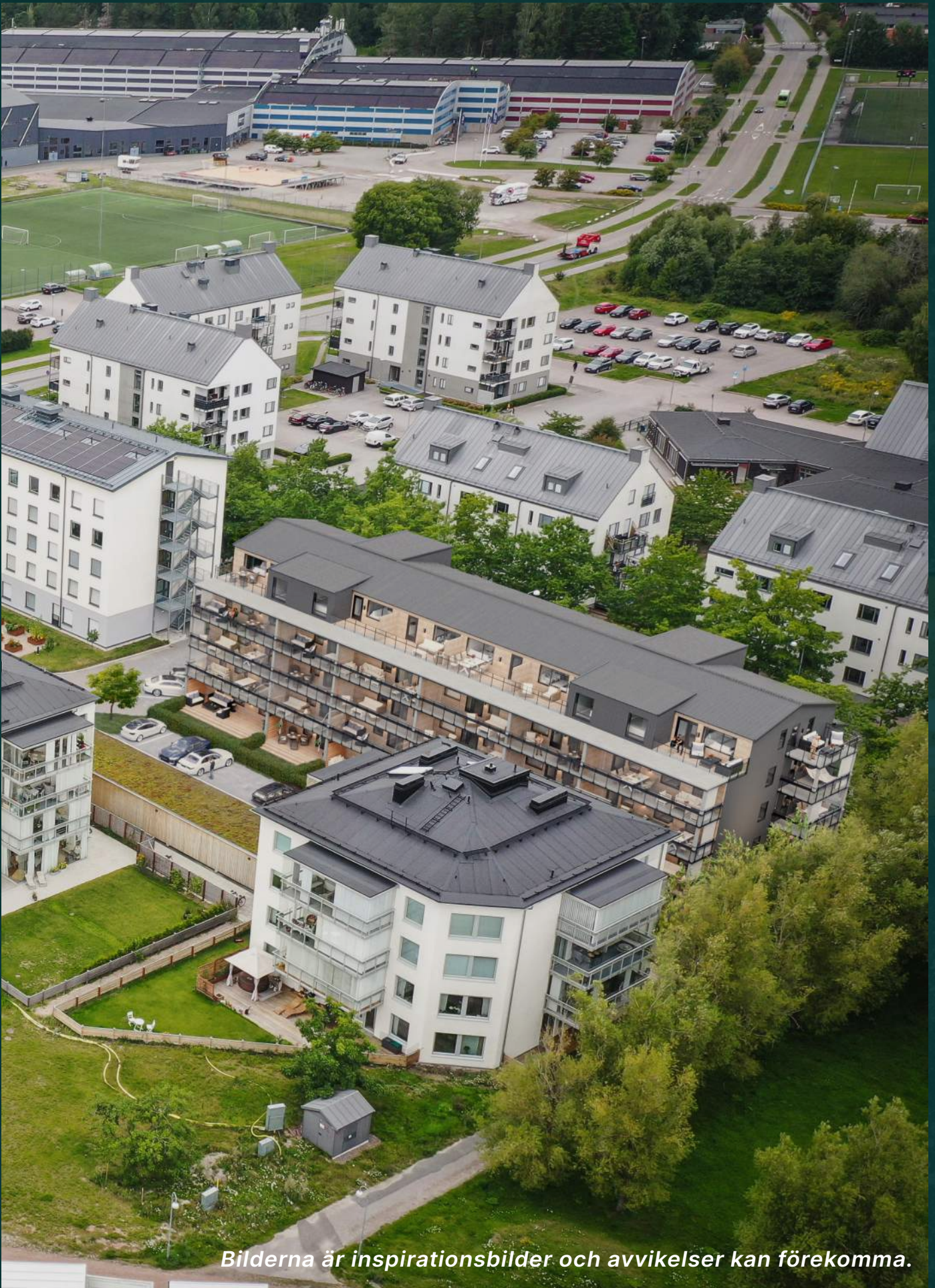
Bilderna är inspirationsbilder och avvikelser kan förekomma.